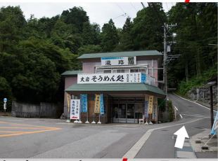
大岩のバスロータリー