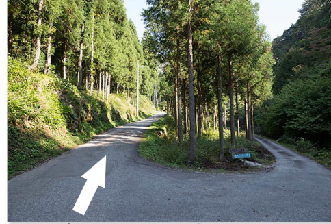
湧き水の分かれ。左です。