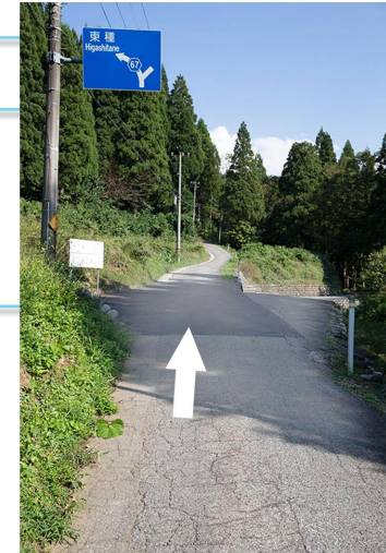
標識下の分かれ。花の家はとにかく左です。