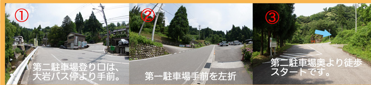
① 第二駐車場登り口は、大岩バス停より手前。