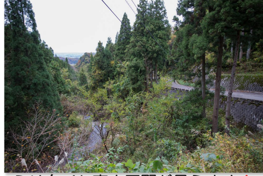
ふり向くと富山平野が見えます。