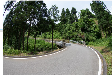
第二の急坂のはじまり