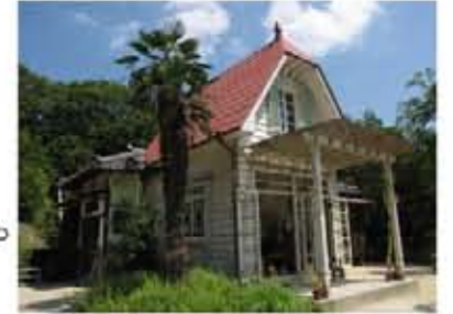
万博会場に建築された「サツキとメイの家」

「となりのトトロ」1988年上映。 翌年よりTV放送が繰り返される事により不動の人気を得る。 2005年「愛・地球博」名古屋万国博覧会において、「家」を再現。全パビリオン中最高の入場者数を記録。