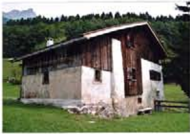
スイス マイエンフェルト村ハイジの家

「アルプスの少女ハイジ」1974年放送のTVアニメ。 舞台モデルのスイスにはいまだに日本からをはじめ、世界中から観光客が来訪。観光業で村が成り立つ。